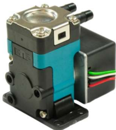
FF 20 DCB-4